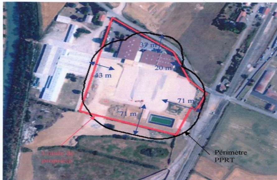
Carte 1. Périmètre PPRT